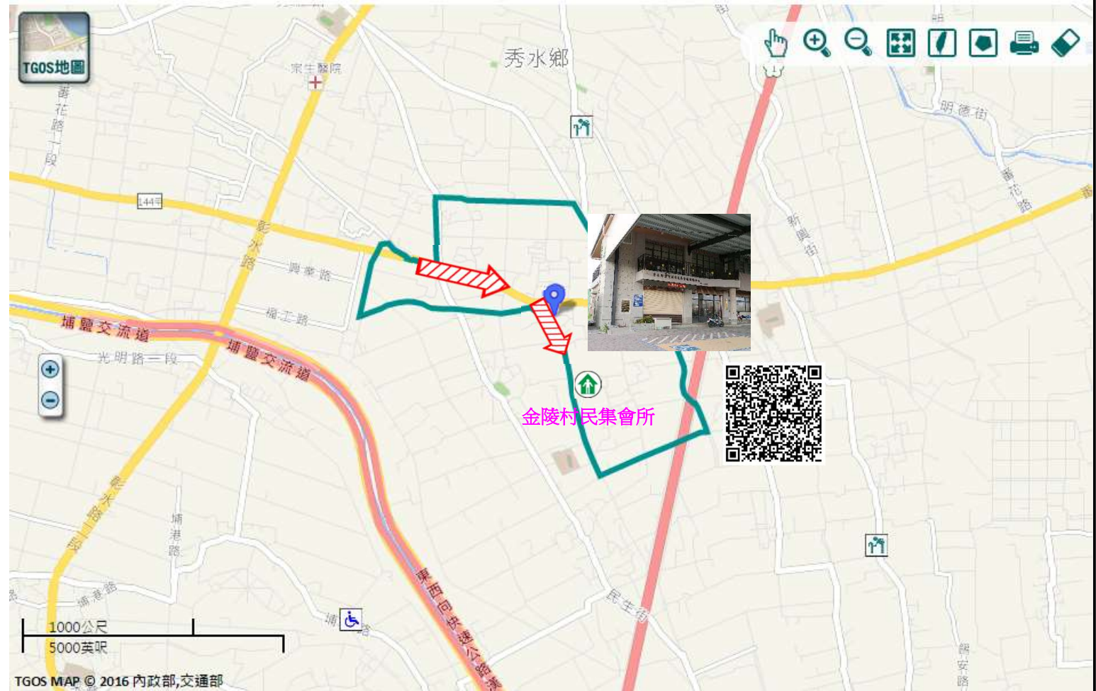
TGOS MAP