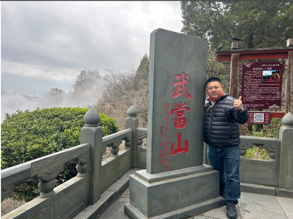
武當山之現勘情況