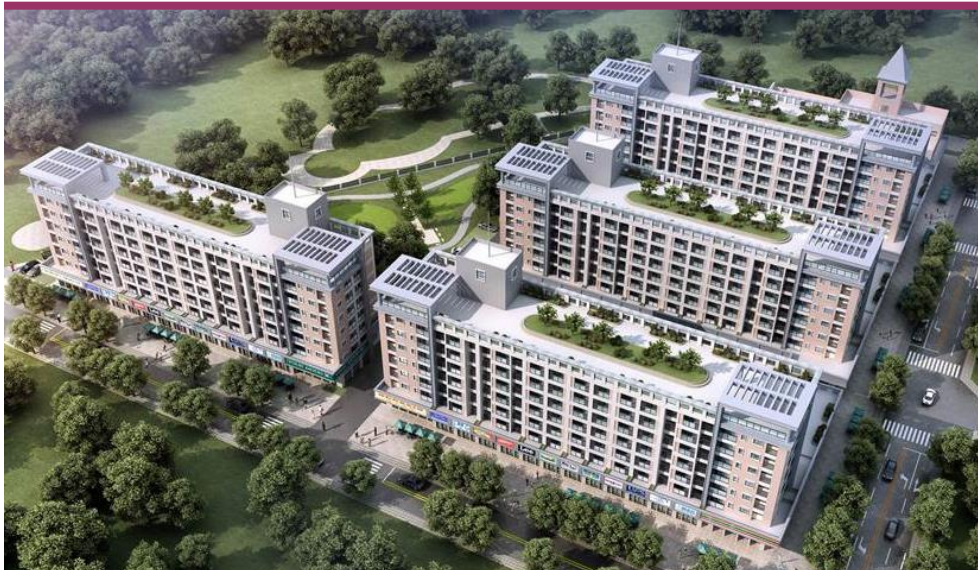
規劃興建中，圖片僅供示意