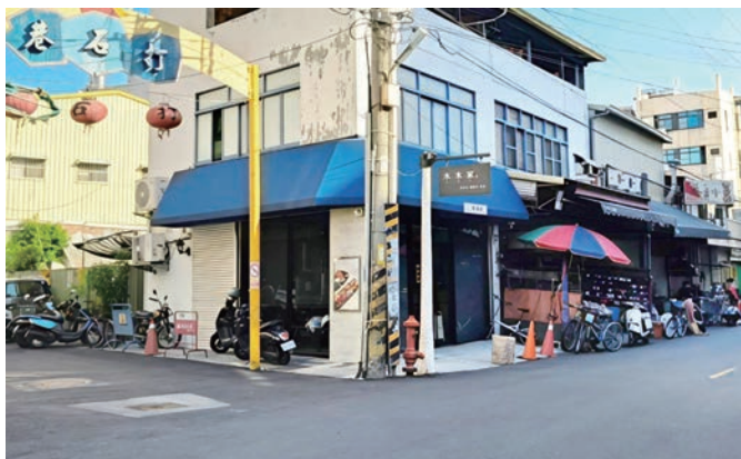
光明街番薯市與打石巷交會。

打石巷中段與光明街垂直交叉，1945 年後發展出南番薯市、北竹廣市。早期許多人群聚進行番薯交易買賣，因而得名番薯市，發展至今，約在惠來街與民生路之間的光明街南段，番薯市是鄉親喜愛的市集，尤其是漢藥滷製的雞腳凍遠近馳名，麥芽糖熬製的蜜地瓜飄散著古早味，還有燒麻糬與八寶圓仔冰，都是一甲子懷念的老口味。