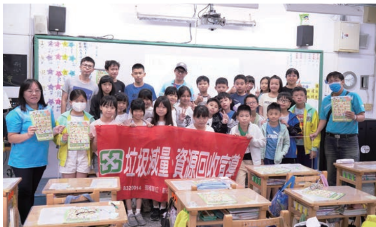
員林市清潔隊前往僑信國小進行環境議題交流，落實環保校園教育。