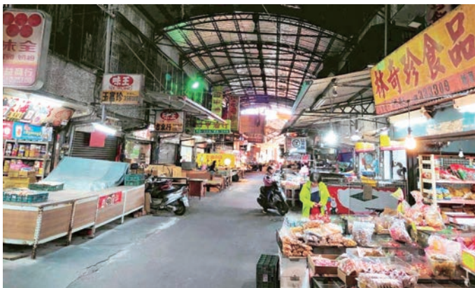
北門商圈華成市場鮮果、服飾、小吃多，晚上還有夜市可逛。

華成市場寬闊多樣，主要介於浮圳路與博愛路交界一帶，由於周邊各路段繁榮，又稱為北門商圈。內行人喜歡來批貨購買，新鮮蔬果、鮮肉、小吃、糖果餅乾、糕糕、衣物服飾、生活用品，任君選擇多元滿足。市場內有早市、市場周邊熱鬧滾滾，晚上還有許多夜市小吃。加上靜修路康橋商旅員林館方便住宿，吸引許多外地人走訪。