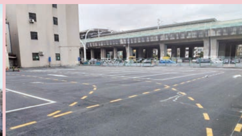
市中心立體停車塔因設施老化而拆除（左圖），先行規劃平面停車場（右圖），未來將依照商業區容許用途規劃。