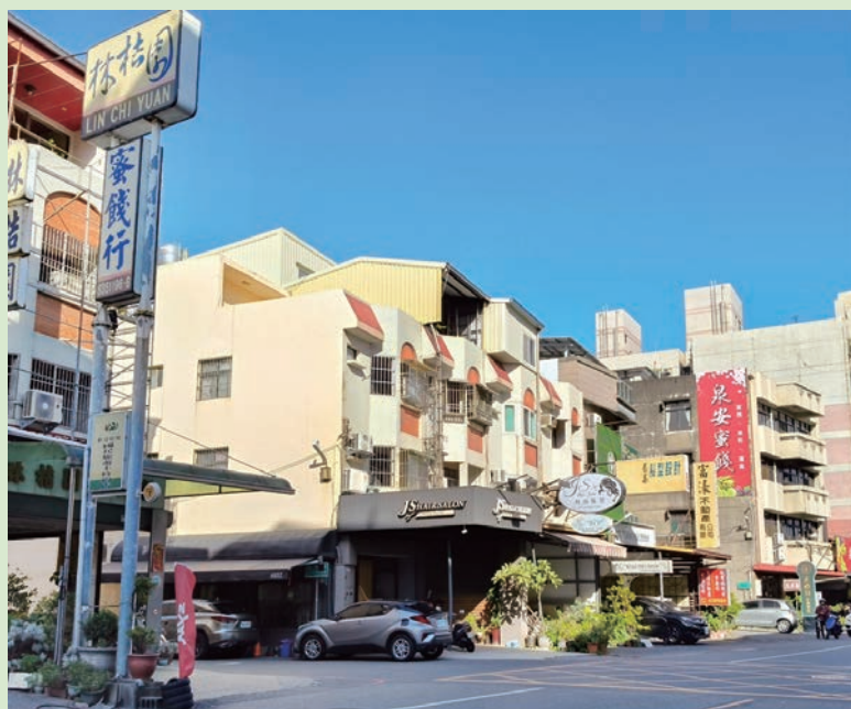
員水路兩旁蜜餞工廠、店家林立，成為選購「鹹酸甜」的熱門地點。

來到員林市不如邁開腳步，三五成群來趟蜜餞王國尋寶趣，沉浸在鹹酸甜的街道巷弄間，勢必會有道地的員林古早味新發現。讓我們一起跟著鹹酸甜，尋找員水路兩旁的蜜餞老店頭，林桔園、泉安、富順、允建、明源、徑新、良泰、富田、鴻昌、明興、長發、泰泉等 20 餘家。若想繼續尋找員林蜜餞版圖，另有分布點值得走訪，諸如：山腳路、崙雅巷、大峯巷、涇洲巷、出水巷、錦安巷、麒麟巷、三條街、大饒路、浮圳路、中山路、大同路、源潭