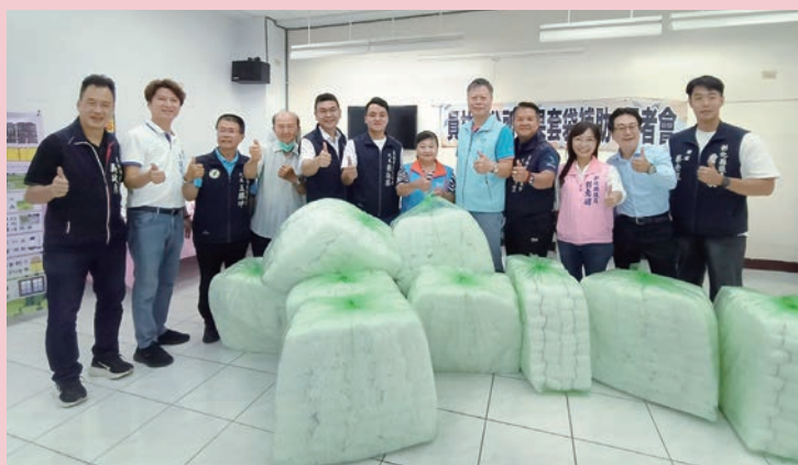
「公所牌水果套袋」發放活動。