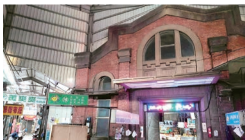
歷史建築原員林街消費市場。

三山國王廟廣寧宮竣工後，周邊生活物資交易熱絡，形成打石巷生活市集。1902 年廟左側，建立員林街消費市集，地方慣稱虎頭門，回字形建築、天井置中。西北正門，東北出口民生路，東南出口惠來東街，西南出口中正路。