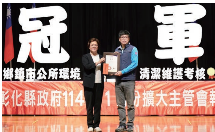
員林市公所榮獲彰化縣政府 113 年度環境清潔維護考核冠軍。

鑑於 113 年 7 月起，彰化縣實施嚴格的垃圾分類辦法，規定垃圾袋內若是含有超過 12 件可回收物，或有 30% 以上生熟廚餘，整車垃圾都將退運。員林市清潔隊因應新的環保規範，從 113 年 5 月起成立「垃圾分類稽查小組」，每天隨著垃圾車向市民宣導垃圾分類政策，並在全市 15 條垃圾清運路線定時定點執行破袋稽查，使垃圾減量成效卓著。