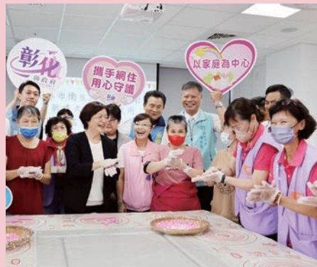
員林市衛生所暨長照衛福新建大樓正式落成啟用。