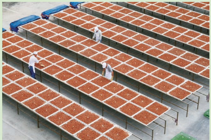
員林梅香莊專業製梅，行銷多國（梅香莊提供）。

有些工廠還自創門市與品牌，積極外銷到美、日、加、韓、印、新、菲等國家。員林蜜餞以梅、李、橄欖、芒果為大宗，加上季節常見果類應有盡有。那熟悉又吸引人的鹹酸甜味，成為年節最佳伴手禮。日夜飄散員林街弄，挑起許多早年生活回憶，百果盛產的蜜餞香，讓員林成為名符其實的「蜜餞故鄉」。