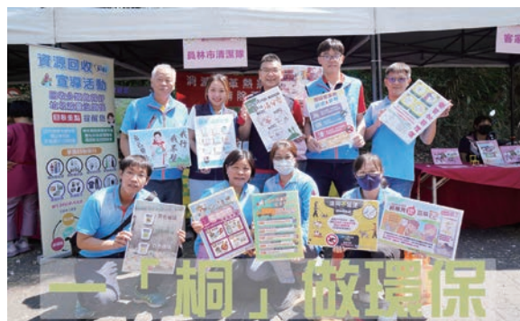
製作宣導海報，使市民瞭解垃圾分類方法。

此外，市公所也和學校合作，將環保教育向下扎根，讓學校加強環保教育，將垃圾減量落實到家庭生活。