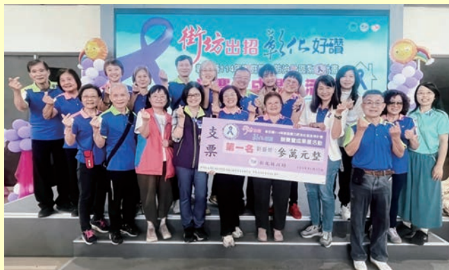
十七份社區獲彰化縣政府防暴社區競賽暨成果展分組第一名。