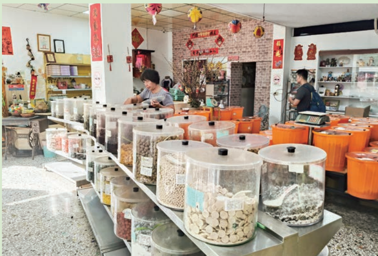
員林鹹酸甜百年好滋味，攝於泉安蜜餞行。

1990 年代以後，蜜餞業日漸衰退，1999 年 5 月當年員林鎮公所曾辦理「員林蜜餞嘉年華活動」，期望喚起鹹酸甜的古早味。2006 年臺灣工商普查記載，員林蜜餞工廠與門市店計 42 家，縱使 2009 年員林蜜餞業僅剩 30 家左右，多半仍在員水路與山腳路一帶，其餘零星店家散佈在東區各里。為振興蜜餞產業，市公所曾輔導將百果山風景區旁蜜餞廠，規劃為蜜餞產業文化館，展示發展史與製作過程。