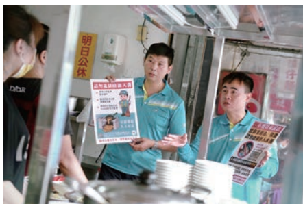
向店家宣導廢油回收、殘渣瀝乾分類，絕不直排入水溝。