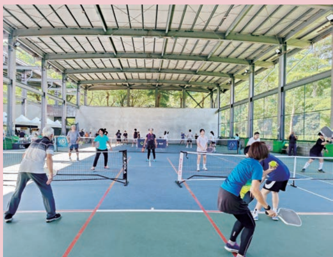
114 年員林市長盃匹克球錦標賽。