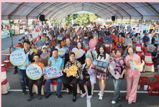
「走出健康 引以為農」農特產推廣暨寵物同樂會活動吸引市民熱烈參與。