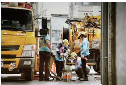
清潔隊投入大量人力物力進行清淤，讓乾淨城市成為員林永續的日常。