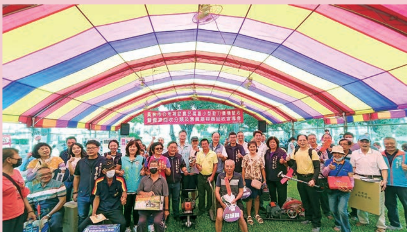
114 年度補助農民購置小型動力農機驗收暨資源回收及廢農藥容器回收宣導。