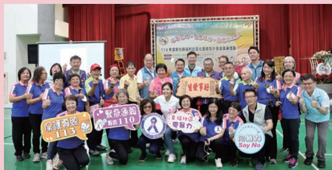
114 年度彰化縣福利社區化旗艦型計畫成果展。