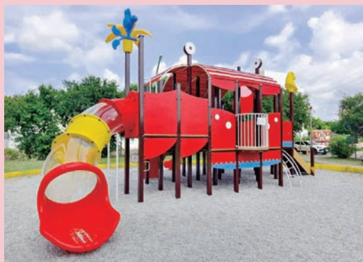
員林市兒童遊戲場改善工程榮獲第二屆「彰化縣政府公共工程」優質獎。