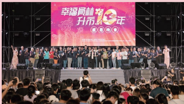
熱情民衆滿懷喜悅之情，踴躍參加升市 10 年晚會。