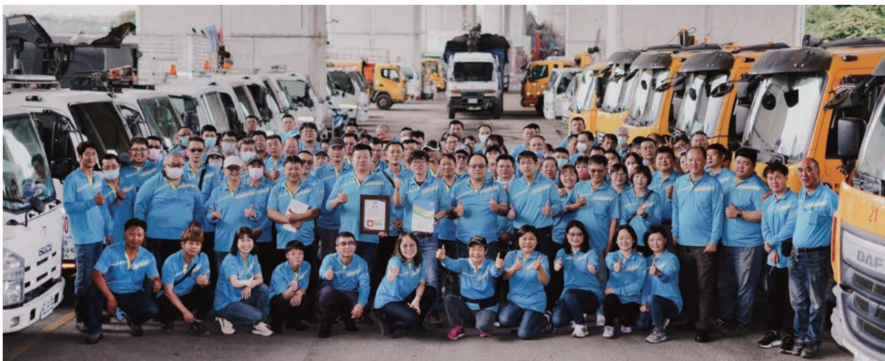
員林清潔隊員上下一心，榮獲雙冠王。