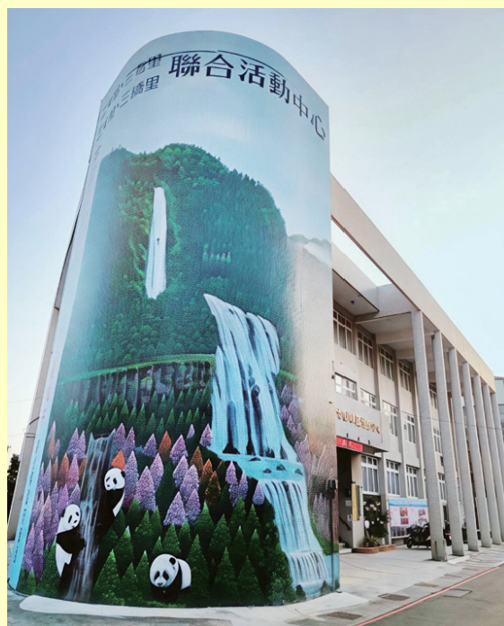
十七份社區活動中心是社區共同意象。

整個社區就像一個幸福大家庭，主動關懷社區老人，積極宣導防暴防詐，並綠美化環境活用社區空間，位於興華街 21 號的聯合活動中心，外牆彩繪壯觀顯眼。四里聯合的社區大家庭發展備受肯定。●員林