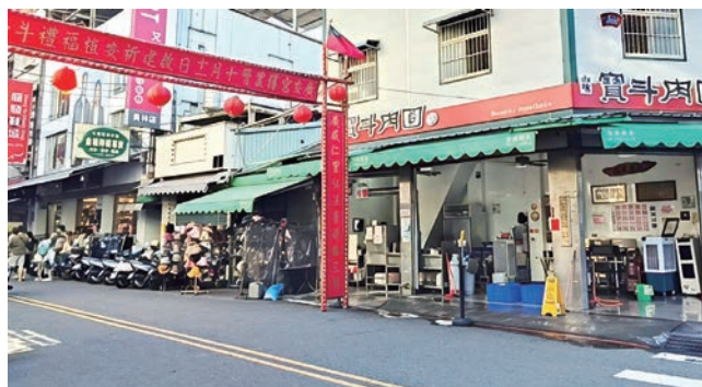
光明街北段竹廣市天天熱鬧。

竹廣市約在三山國王廟廣安宮前一帶，早年許多人搭竹篷賣東西得名，後雅名竹廣市。由於離火車站近，人潮絡繹不絕，魚肉蔬果、小吃、修改衣服、麵條、刻印、服裝等應有盡有。各種商店陸續增添，曾設有文化戲院，1980 年代已整建為樓房街屋。發展至今，約在民生路與民權路之間的光明街北段，如：在地傳承多年的竹廣香花生糖、肉圓、拉仔麵等店家林立，成為老少皆愛的市集。