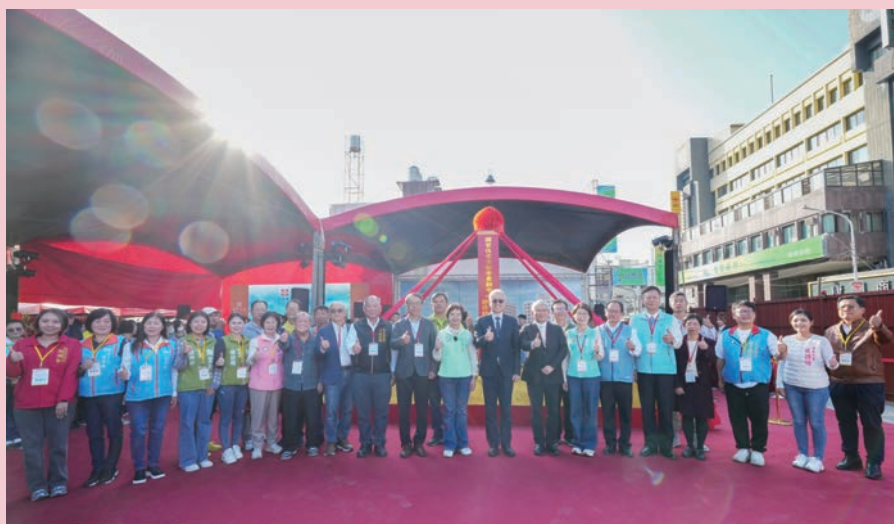
員林市首座社會住宅－靜修好室 正式動土，提供市民更多元、友善的居住選擇。