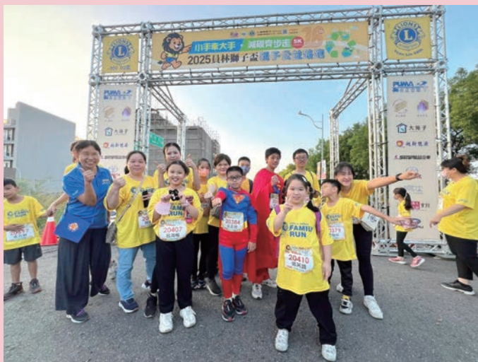
大手牽小手 減碳齊步走 -2025 第十六屆員林獅子盃親子公益路跑活動開跑。