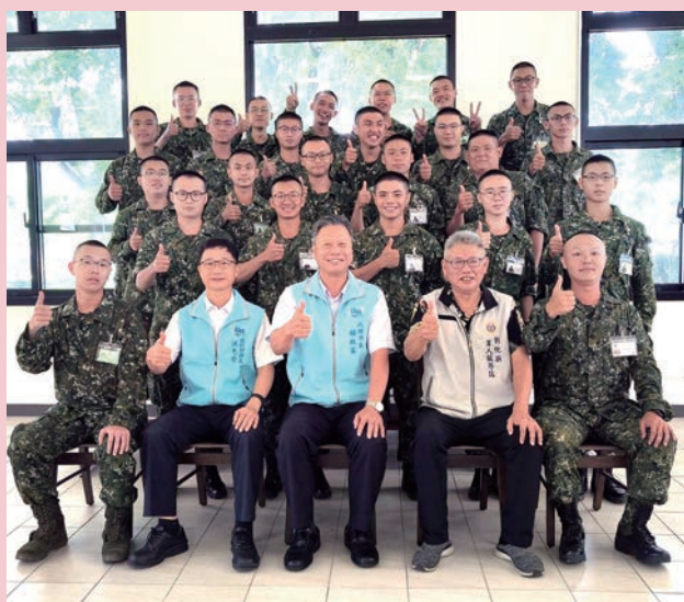
前往成功嶺，慰問本市服役中的役男。