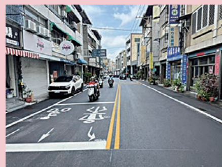
關心民衆行的安全，市公所陸續完成大同路、新生路及南昌路等道路鋪面及標示優化，以提供用路人良好道路品質，使交通更順暢。