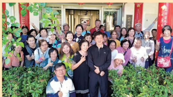
培訓彰化縣文化局志工團。