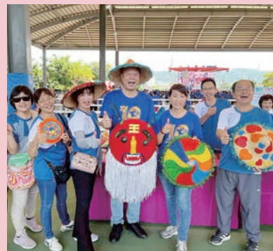
114 年社區樂活趣味競賽熱鬧的場景。