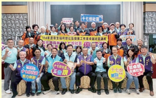
十七份社區獲衛生福利部社區發展工作金卓越社區選拔優等獎。