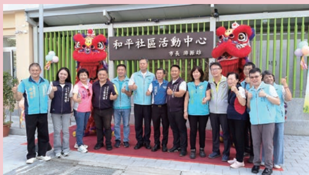
員林市和平社區活動中心落成啟用。