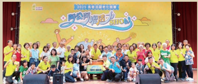
大明社區榮獲「2025 衛生福利部國民健康署全國阿公阿嬤活力 SHOW」中區五縣市銀牌獎、全國總決賽最佳活力獎。（社區提供）。