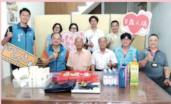
九月九慶重陽、敬老尊賢傳真情。