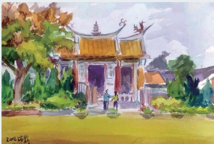
彩繪古蹟興賢書院。

公園裡經常舉辦活動，也是員林燈會的主要場地，位於公園內的縣定古蹟興賢書院，是遊客經常造訪的景點。