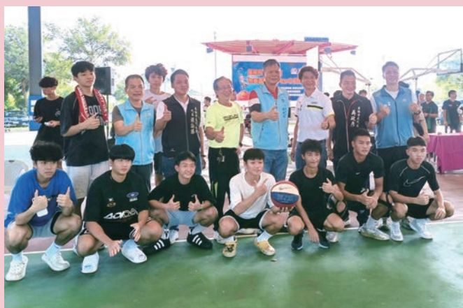
114 年員林市長盃三對三籃球鬥牛錦標賽。