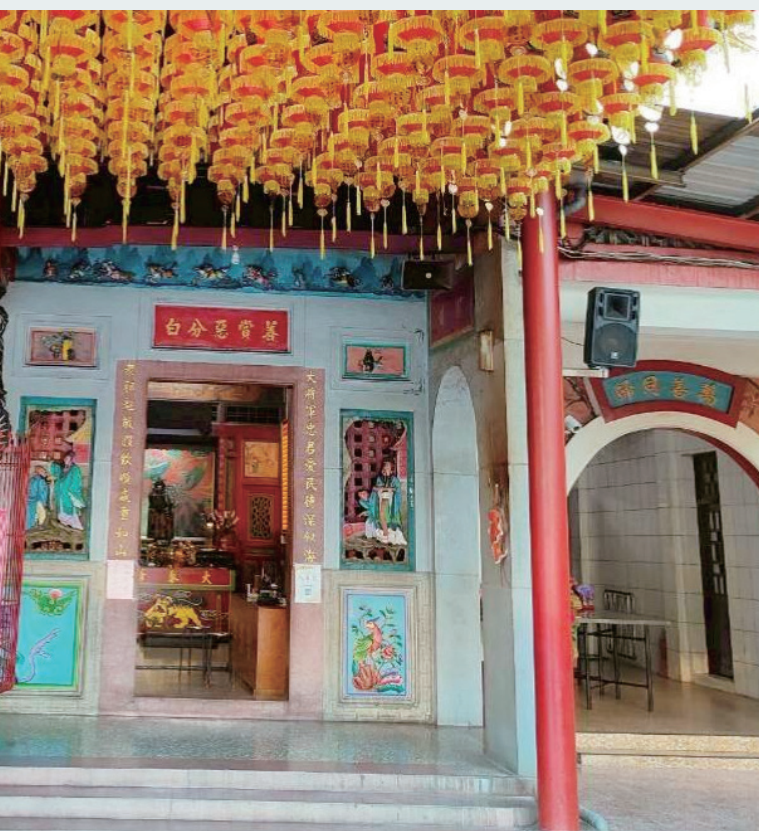
地藏庵廟中廟有特色。