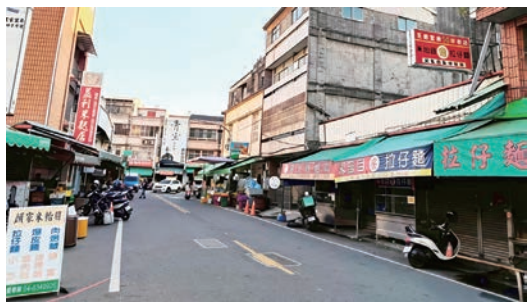
博愛路特色小吃與蔬果多。

1940 年代，廣寧宮後方員林醫院、保安堂、紫雲醫院、天主堂相接連，教會前設有輕便車場，因多家米苔目麵攤聚集，因而慣稱米苔目街。晚近博愛路拓寬，南接第一市場，沿路新鮮蔬果接連不斷，尤其是多家顯目的水果店面，早已形成新市集。還有許多老店經營，長年人潮擁擠又熱鬧，北通華成市場串聯成本市重要生活圈。