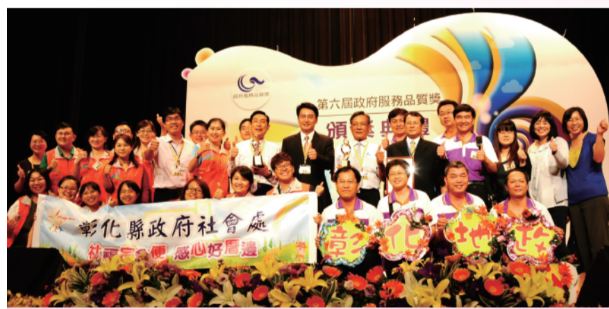
▲柯副縣長率同仁北上領取兩座政府服務品質獎。